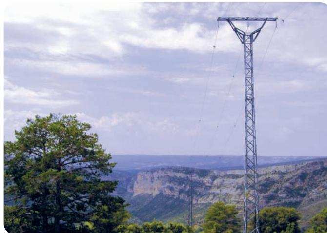
Señalización de los conductores en la Línea de Pitarque a Montoro de la Mezquita (20 Kv) en la ZEPA de Río Guadalope-Maestrazgo