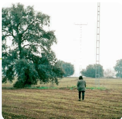
Prospección de tendidos eléctricos