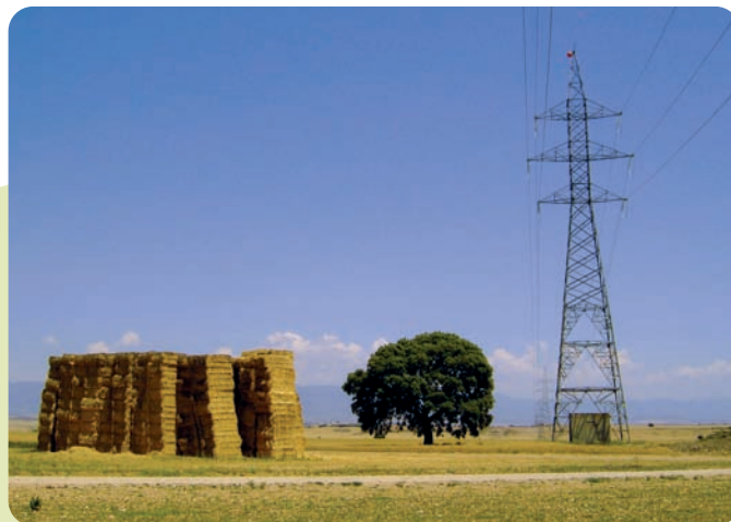
Señalización del cable de tierra en la Línea de Sabiñánigo a Gurrea (220 Kv) dentro de la ZEPA del Embalse de La Sotonera