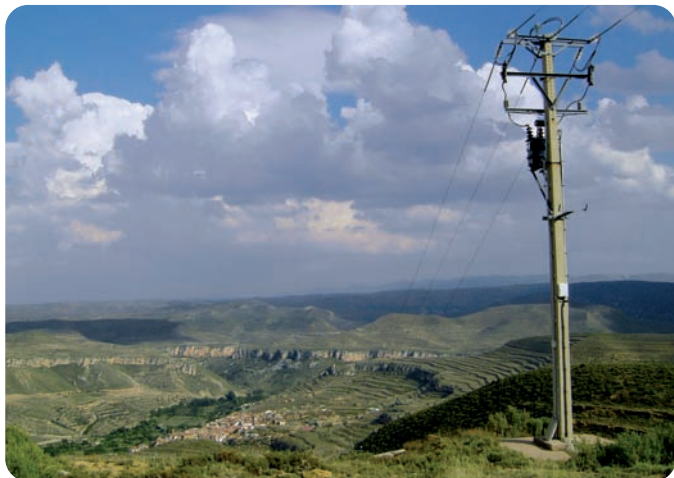
Aislamiento de puente flojo, bajantes y conductores en la Línea de Josa a Obón (15 Kv) en la ZEPA de los desfiladeros del Río Martín