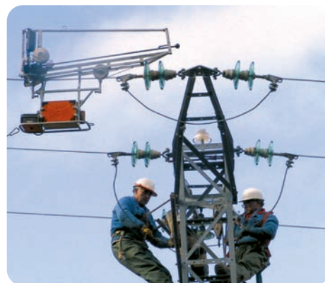
Colocación de balizas salvapájaros "X" de neopreno en los cables conductores mediante robot guiado.