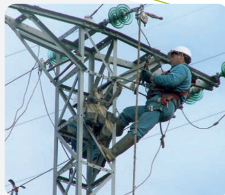
Corrección de apoyos para evitar accidentes por electrocución