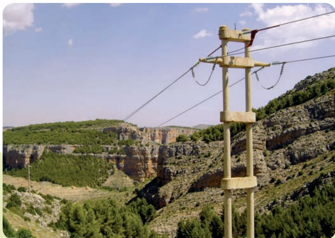
Puentes flojos suspendidos y conductores aislados en la Línea de Campillo a Calmarza (15 Kv) dentro de la ZEPA de las Hoces del Río Mesa