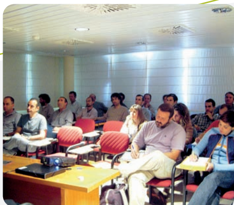
Cursos de formación del personal de campo del Gobierno de Aragón