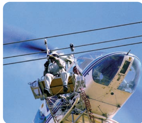
Colocación manual de balizas salvapájaros espirales en los cables de tierra mediante helicóptero.